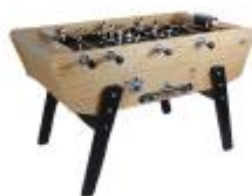
STAR / XXL