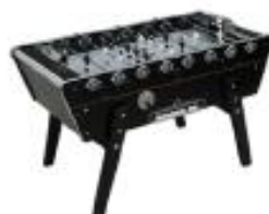
CHAMPION / TOI & MOI