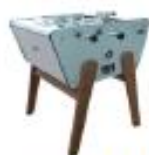
TOI & MOI OUTDOOR